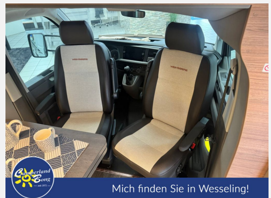
Mich finden Sie in Wesseling!