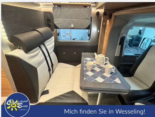
Mich finden Sie in Wesseling!