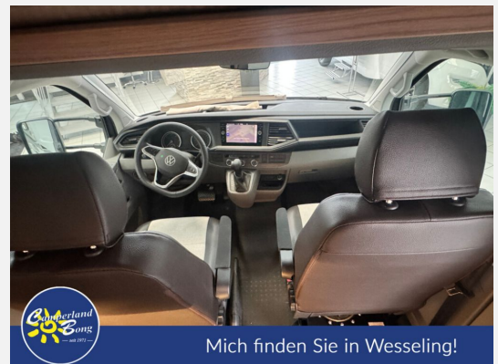
Mich finden Sie in Wesseling!