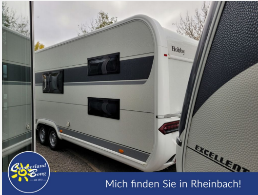
Mich finden Sie in Rheinbach!