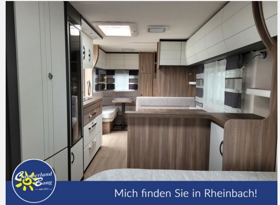
Mich finden Sie in Rheinbach!