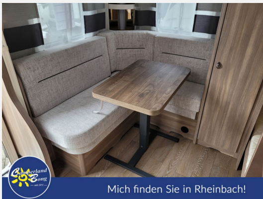
Mich finden Sie in Rheinbach!