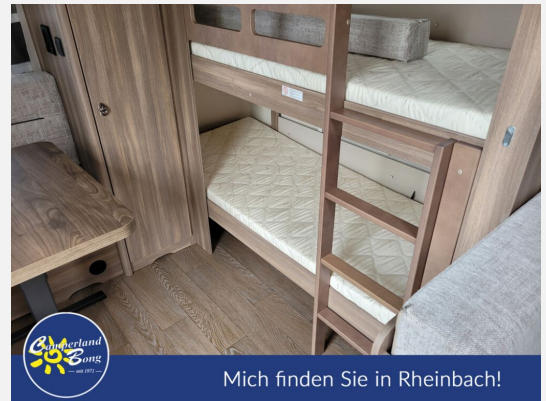
Mich finden Sie in Rheinbach!