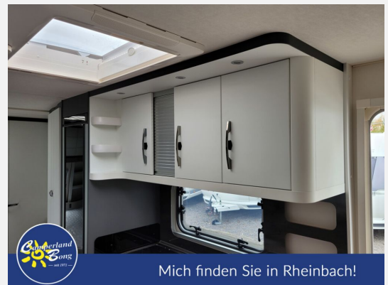
Mich finden Sie in Rheinbach!