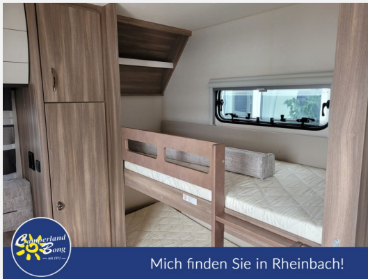
Mich finden Sie in Rheinbach!