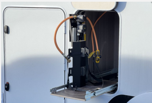
Mercedes-Benz LAIKA ETRVSCO CROSSCAMP Dethleffs THORWESTEN