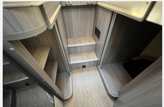
Mercedes-Benz LAIKA ETRVSCO CROSSCAMP Dethleffs THORWESTEN