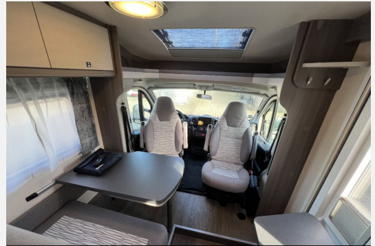
Mercedes-Benz LAIKA ETRVSCO CROSSCAMP Dethleffs THORWESTEN