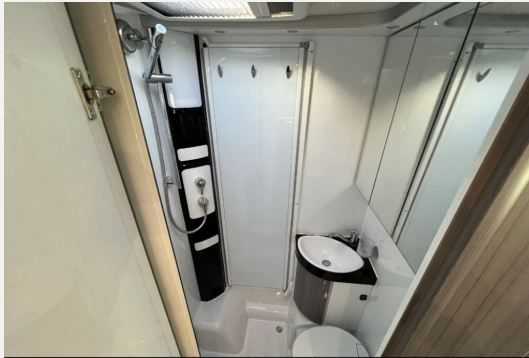
Mercedes-Benz LAIKA ETRVSCO CROSSCAMP Dethleffs THORWESTEN