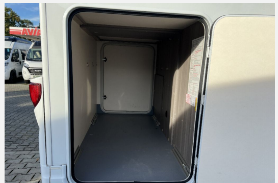
Mercedes-Benz LAIKA ETRVSCO CROSSCAMP Dethleffs THORWESTEN