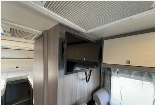
Mercedes-Benz LAIKA ETRVSCO CROSSCAMP Dethleffs THORWESTEN