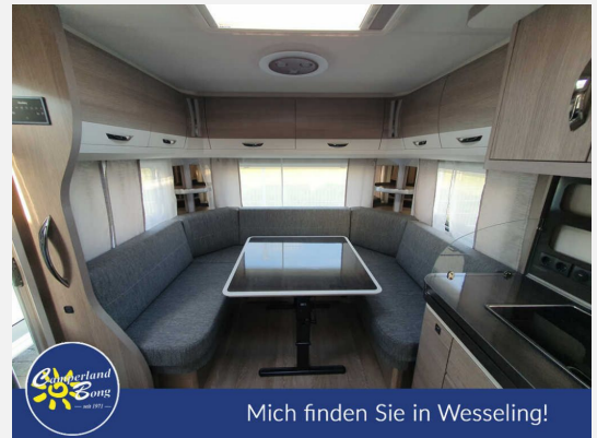
Mich finden Sie in Wesseling!