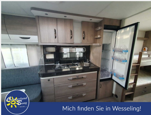
Mich finden Sie in Wesseling!