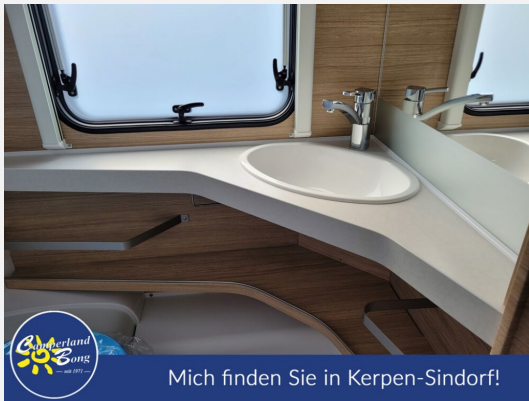
Mich finden Sie in Kerpen-Sindorf!