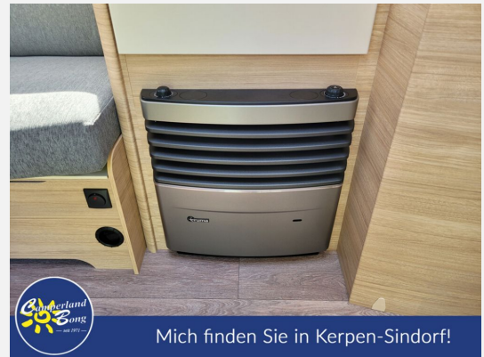
Mich finden Sie in Kerpen-Sindorf!