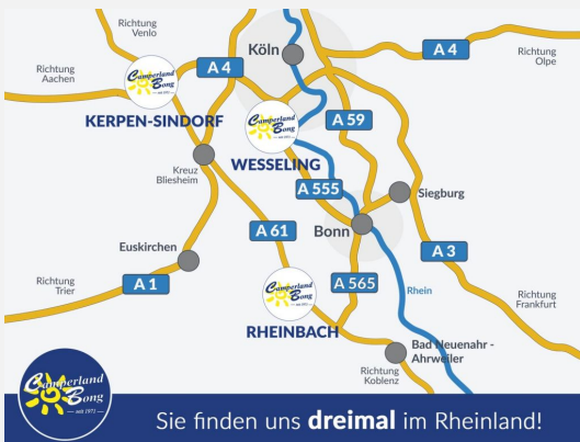
Sie finden uns dreimal im Rheinland!