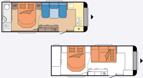
Grundriss Tag/Nacht: Hobby MAXIA 660 WQM 2024