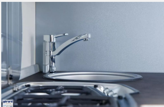
gérard Caravaning 08803 / 63 64-0 info@wohnen-gerard.de KNAUS WEINBERG INTER CARAVANNING RENT-2-TRAVEL FENDT CARAVAN