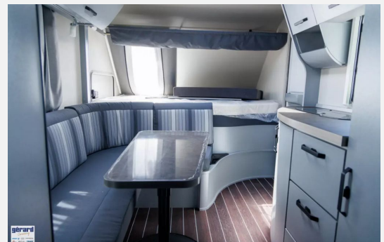
gérard Caravaning 08803 / 63 64-0 info@wohnen-gerard.de KNAUS WEINBERG INTER CARAVANNING RENT-2-TRAVEL FENDT CARAVAN