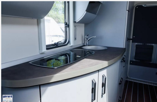
gérard Caravaning 08803 / 63 64-0 info@wohnen-gerard.de KNAUS WEINBERG INTER CARAVANNING RENT-2-TRAVEL FENDT CARAVAN