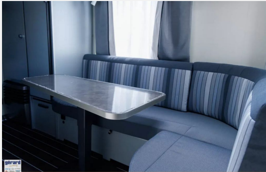
gérard Caravaning 08803 / 63 64-0 info@wohnen-gerard.de KNAUS WEINBERG INTER CARAVANNING RENT-2-TRAVEL FENDT CARAVAN