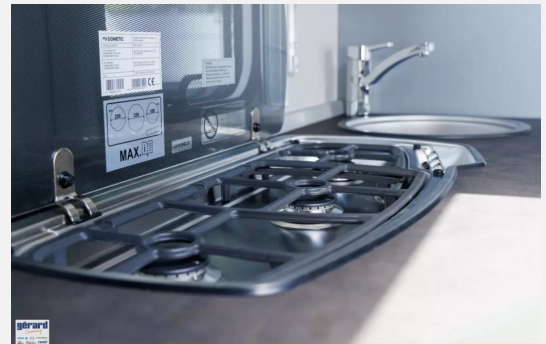
gérard Caravaning 08803 / 63 64-0 info@wohnen-gerard.de KNAUS WEINBERG INTER CARAVANNING RENT-2-TRAVEL FENDT CARAVAN