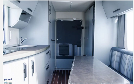
gérard Caravaning 08803 / 63 64-0 info@wohnen-gerard.de KNAUS WEINBERG INTER CARAVANNING RENT-2-TRAVEL FENDT CARAVAN