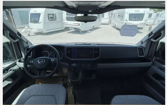
gérard Caravaning 08803 / 63 64-0 info@wohnwagen-gerard.de KNAUS WEINBERG RENT-2-TRAVEL FENDT CARAVAN INFO CARAVANING