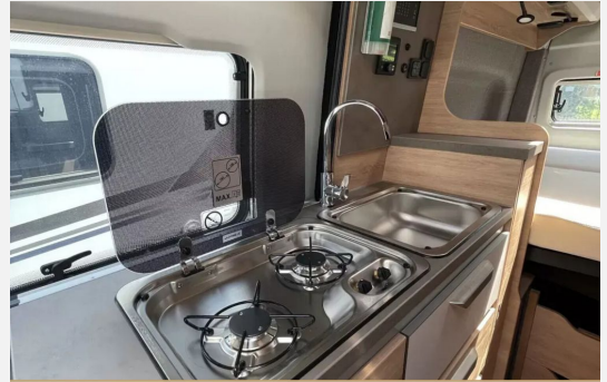
gérard Caravaning 08803 / 63 64-0 info@wohnwagen-gerard.de KNAUS WEINBERG RENT-2-TRAVEL FENDT CARAVAN INFO CARAVANING