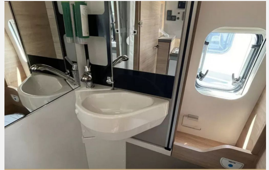
gérard Caravaning 08803 / 63 64-0 info@wohnwagen-gerard.de KNAUS WEINBERG RENT-2-TRAVEL FENDT CARAVAN INFO CARAVANING