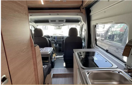
gérard Caravaning 08803 / 63 64-0 info@wohnwagen-gerard.de KNAUS WEINBERG RENT-2-TRAVEL FENDT CARAVAN INFO CARAVANING