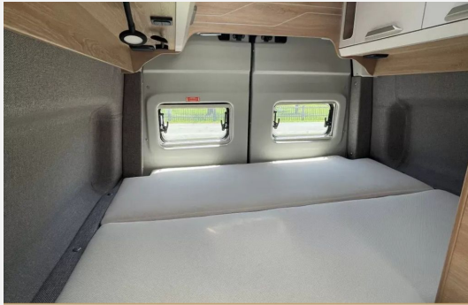
gérard Caravaning 08803 / 63 64-0 info@wohnwagen-gerard.de KNAUS WEINBERG RENT-2-TRAVEL FENDT CARAVAN INFO CARAVANING