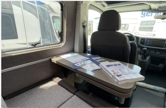
gérard Caravaning 08803 / 63 64-0 info@wohnwagen-gerard.de KNAUS WEINBERG RENT-2-TRAVEL FENDT CARAVAN INFO CARAVANING