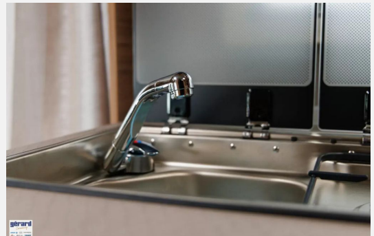
gérard Caravanning 08803 / 63 64-0 info@wohnwagen-gerard.de KNAUS WEINBERG RENT OF TRAVEL FENOT CARAVAN INTER CARAVANNING