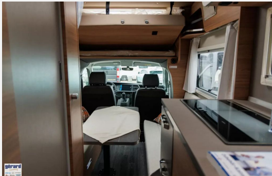
gérard Caravanning 08803 / 63 64-0 info@wohnwagen-gerard.de KNAUS WEINBERG RENT OF TRAVEL FENOT CARAVAN INTER CARAVANNING