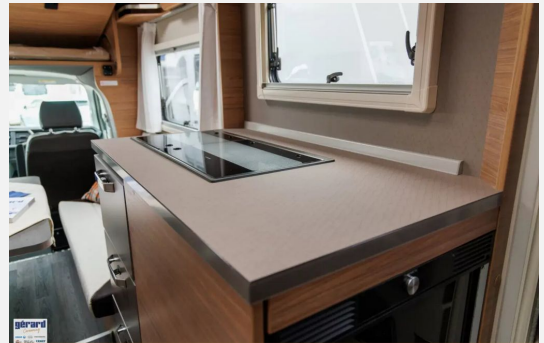
gérard Caravanning 08803 / 63 64-0 info@wohnwagen-gerard.de KNAUS WEINBERG RENT OF TRAVEL FENOT CARAVAN INTER CARAVANNING