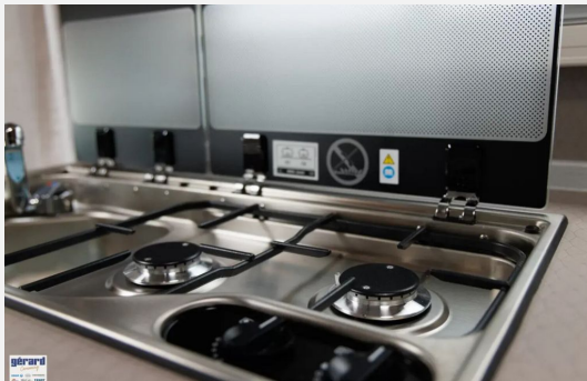
gérard Caravanning 08803 / 63 64-0 info@wohnwagen-gerard.de KNAUS WEINBERG RENT OF TRAVEL FENOT CARAVAN INTER CARAVANNING