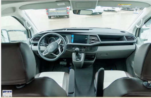
gérard Caravanning 08803 / 63 64-0 info@wohnwagen-gerard.de KNAUS WEINBERG RENT OF TRAVEL FENOT CARAVAN INTER CARAVANNING