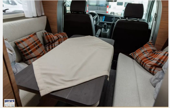
gérard Caravanning 08803 / 63 64-0 info@wohnwagen-gerard.de KNAUS WEINBERG RENT OF TRAVEL FENOT CARAVAN INTER CARAVANNING