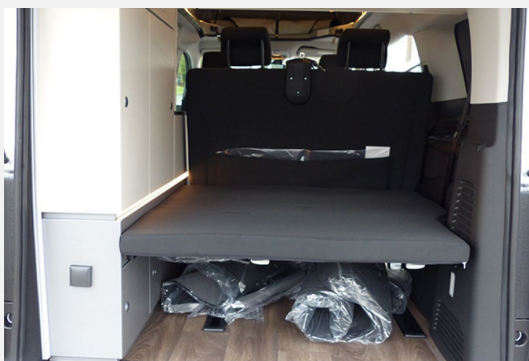
Camper NRW by Hartmann GmbH – Verkauf, Vermietung und Service von Reisemobilen Alfred-Nobel-Str. 7 | 41515 Grevenbroich | Tel.: 021 81 / 65 86-10 88 | anfrage@camper-nrw.de | www.camper-nrw.de