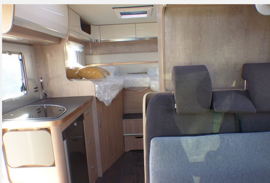
Camper NRW by Hartmann GmbH – Verkauf, Vermietung und Service von Reisemobilen Alfred-Nebel-Str. 7 | 41515 Grevenbroich | Tel.: 021 81 / 65 56-10 00 | anfragen@camper-nrw.de | www.camper-nrw.de CAMPER NRW