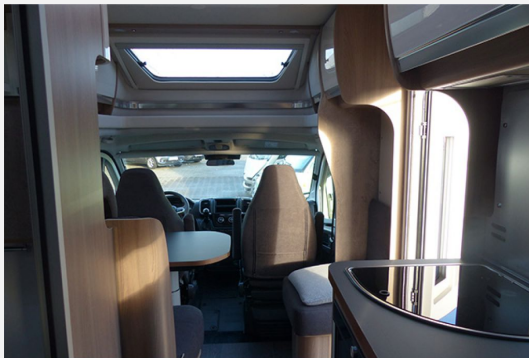
Camper NRW by Hartmann GmbH – Verkauf, Vermietung und Service von Reisemobilen Alfred-Nebel-Str. 7 | 41515 Grevenbroich | Tel.: 021 81 / 65 56-10 00 | anfragen@camper-nrw.de | www.camper-nrw.de CAMPER NRW