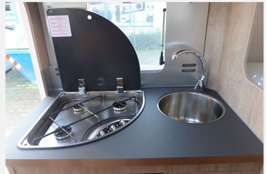
Camper NRW by Hartmann GmbH – Verkauf, Vermietung und Service von Reisemobilen Alfred-Nebel-Str. 7 | 41515 Grevenbroich | Tel.: 021 81 / 65 56-10 00 | anfragen@camper-nrw.de | www.camper-nrw.de CAMPER NRW