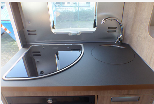
Camper NRW by Hartmann GmbH – Verkauf, Vermietung und Service von Reisemobilen Alfred-Nebel-Str. 7 | 41515 Grevenbroich | Tel.: 021 81 / 65 56-10 00 | anfragen@camper-nrw.de | www.camper-nrw.de CAMPER NRW