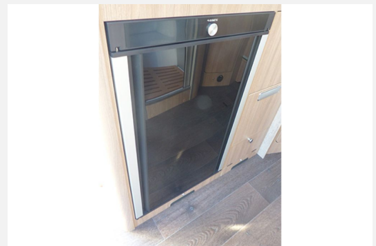
Camper NRW by Hartmann GmbH – Verkauf, Vermietung und Service von Reisemobilen Alfred-Nebel-Str. 7 | 41515 Grevenbroich | Tel.: 021 81 / 65 56-10 00 | anfragen@camper-nrw.de | www.camper-nrw.de CAMPER NRW