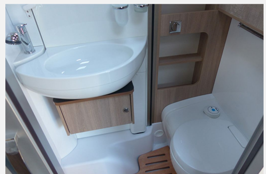
Camper NRW by Hartmann GmbH – Verkauf, Vermietung und Service von Reisemobilen Alfred-Nebel-Str. 7 | 41515 Grevenbroich | Tel.: 021 81 / 65 56-10 00 | anfragen@camper-nrw.de | www.camper-nrw.de CAMPER NRW