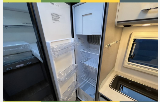
Mercedes-Benz FIAT LAIKA ETRUSCO CROSSCAMP Dethleffs THORWESTEN