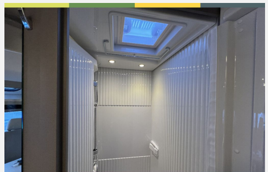
Mercedes-Benz FIAT LAIKA ETRUSCO CROSSCAMP Dethleffs THORWESTEN