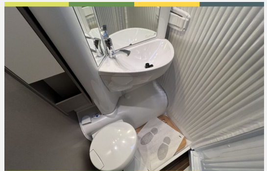
Mercedes-Benz FIAT LAIKA ETRUSCO CROSSCAMP Dethleffs THORWESTEN