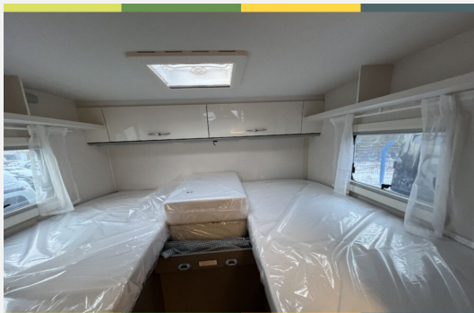
Mercedes-Benz FIAT LAIKA ETRUSCO CROSSCAMP Dethleffs THORWESTEN