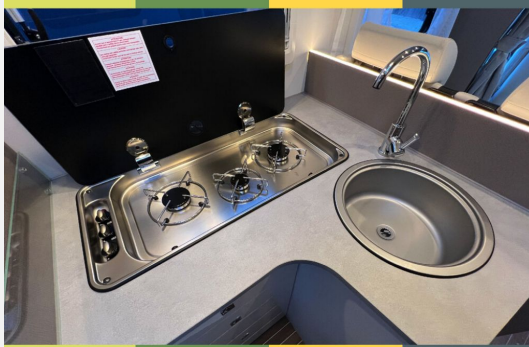
Mercedes-Benz FIAT LAIKA ETRUSCO CROSSCAMP Dethleffs THORWESTEN