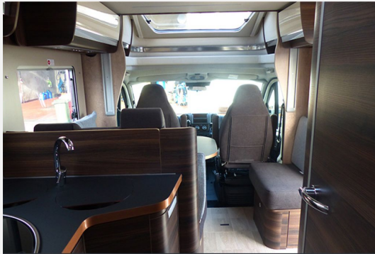
Camper NRW by Hartmann GmbH – Verkauf, Vermietung und Service von Reisemobilen Alfred-Nobel-Str. 7 | 41515 Grevenbroich | Tel.: 021 81 / 65 56-10 00 | anfrage@camper-nrw.de | www.camper-nrw.de