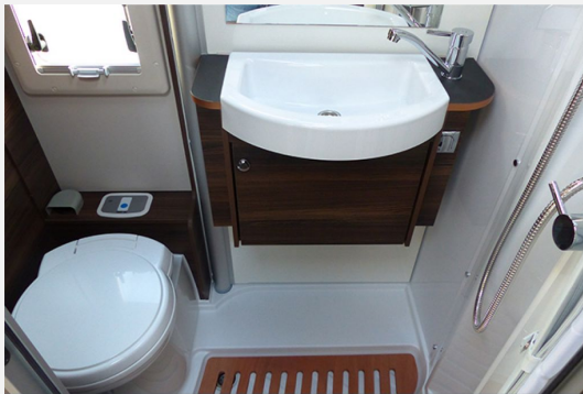
Camper NRW by Hartmann GmbH – Verkauf, Vermietung und Service von Reisemobilen Alfred-Nebel-Str. 7 | 41515 Grevenbroich | Tel.: 021 81 / 65 56-10 00 | anfrage@camper-nrw.de | www.camper-nrw.de CAMPER NRW