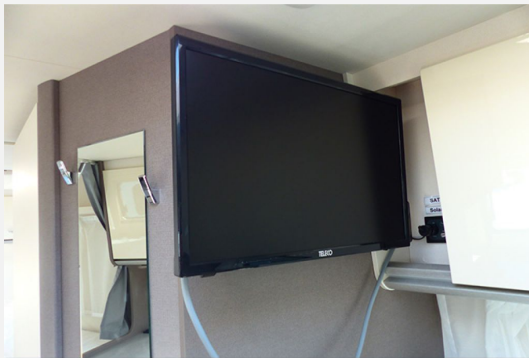
Camper NRW by Hartmann GmbH – Verkauf, Vermietung und Service von Reisemobilen Alfred-Nobel-Str. 7 | 41515 Grevenbroich | Tel.: 021 81 / 65 86-10 88 | anfrage@camper-nrw.de | www.camper-nrw.de