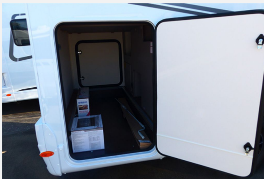
Camper NRW by Hartmann GmbH – Verkauf, Vermietung und Service von Reisemobilen Alfred-Nobel-Str. 7 | 41515 Grevenbroich | Tel.: 021 81 / 65 86-10 88 | anfrage@camper-nrw.de | www.camper-nrw.de