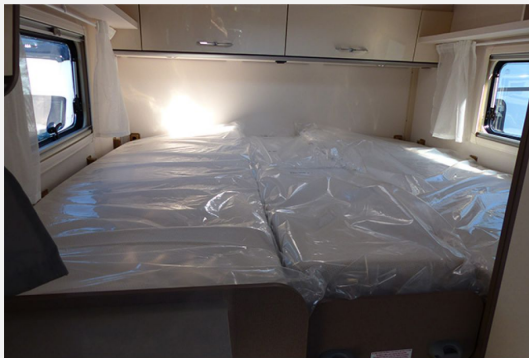
Camper NRW by Hartmann GmbH – Verkauf, Vermietung und Service von Reisemobilen Alfred-Nobel-Str. 7 | 41515 Grevenbroich | Tel.: 021 81 / 65 86-10 88 | anfrage@camper-nrw.de | www.camper-nrw.de