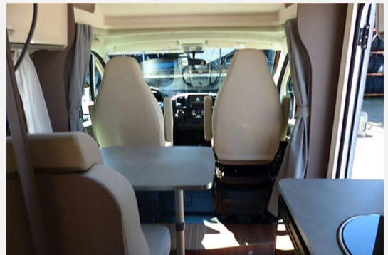
Camper NRW by Hartmann GmbH – Verkauf, Vermietung und Service von Reisemobilen Alfred-Nobel-Str. 7 | 41515 Grevenbroich | Tel.: 021 81 / 65 86-10 88 | anfrage@camper-nrw.de | www.camper-nrw.de