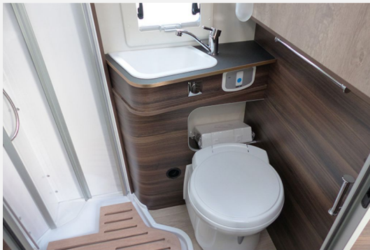
Camper NRW by Hartmann GmbH – Verkauf, Vermietung und Service von Reisemobilen Alfred-Nebel-Str. 7 | 41515 Grevenbroich | Tel.: 021 81 / 65 56-10 00 | anfragen@camper-nrw.de | www.camper-nrw.de CAMPER NRW