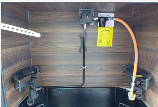
Camper NRW by Hartmann GmbH – Verkauf, Vermietung und Service von Reisemobilen Alfred-Nebel-Str. 7 | 41515 Grevenbroich | Tel.: 021 81 / 65 56-10 00 | anfragen@camper-nrw.de | www.camper-nrw.de CAMPER NRW