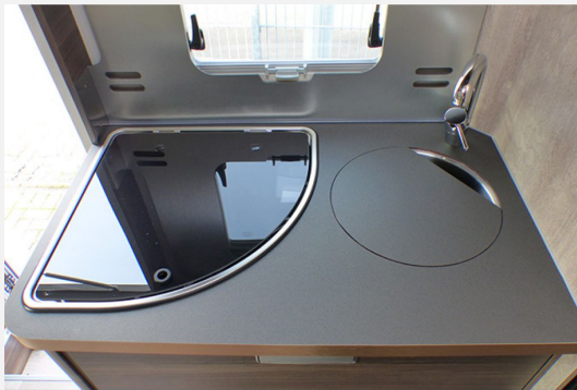
Camper NRW by Hartmann GmbH – Verkauf, Vermietung und Service von Reisemobilen Alfred-Nebel-Str. 7 | 41515 Grevenbroich | Tel.: 021 81 / 65 56-10 00 | anfragen@camper-nrw.de | www.camper-nrw.de