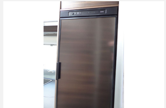
Camper NRW by Hartmann GmbH – Verkauf, Vermietung und Service von Reisemobilen Alfred-Nebel-Str. 7 | 41515 Grevenbroich | Tel.: 021 81 / 65 56-10 00 | anfragen@camper-nrw.de | www.camper-nrw.de CAMPER NRW