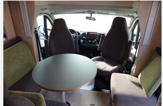
Camper NRW by Hartmann GmbH – Verkauf, Vermietung und Service von Reisemobilen Alfred-Nebel-Str. 7 | 41515 Grevenbroich | Tel.: 021 81 / 65 56-10 00 | anfragen@camper-nrw.de | www.camper-nrw.de