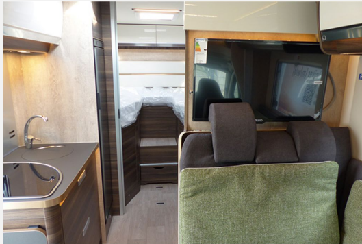
Camper NRW by Hartmann GmbH – Verkauf, Vermietung und Service von Reisemobilen Alfred-Nebel-Str. 7 | 41515 Grevenbroich | Tel.: 021 81 / 65 56-10 00 | anfragen@camper-nrw.de | www.camper-nrw.de