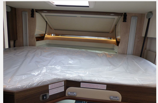
Camper NRW by Hartmann GmbH – Verkauf, Vermietung und Service von Reisemobilen Alfred-Nebel-Str. 7 | 41515 Grevenbroich | Tel.: 021 81 / 65 56-10 00 | anfragen@camper-nrw.de | www.camper-nrw.de CAMPER NRW