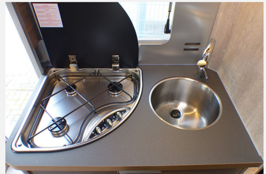
Camper NRW by Hartmann GmbH – Verkauf, Vermietung und Service von Reisemobilen Alfred-Nebel-Str. 7 | 41515 Grevenbroich | Tel.: 021 81 / 65 56-10 00 | anfragen@camper-nrw.de | www.camper-nrw.de