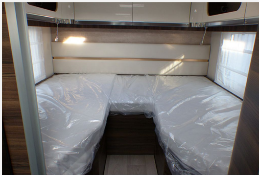
Camper NRW by Hartmann GmbH – Verkauf, Vermietung und Service von Reisemobilen Alfred-Nebel-Str. 7 | 41515 Grevenbroich | Tel.: 021 81 / 65 56-10 00 | anfragen@camper-nrw.de | www.camper-nrw.de CAMPER NRW