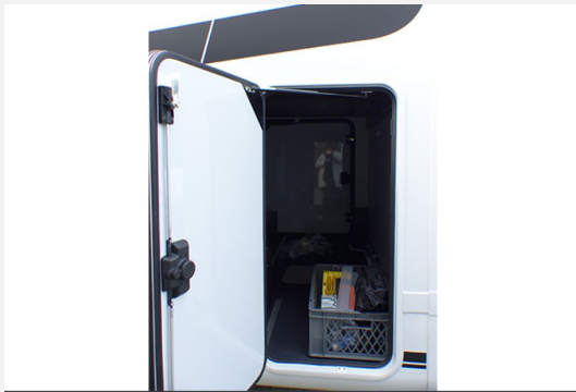
Camper NRW by Hartmann GmbH – Verkauf, Vermietung und Service von Reisemobilen Alfred-Nobel-Str. 7 | 41515 Grevenbroich | Tel.: 02181 / 65 56-10 88 | anfragen@camper-nrw.de | www.camper-nrw.de