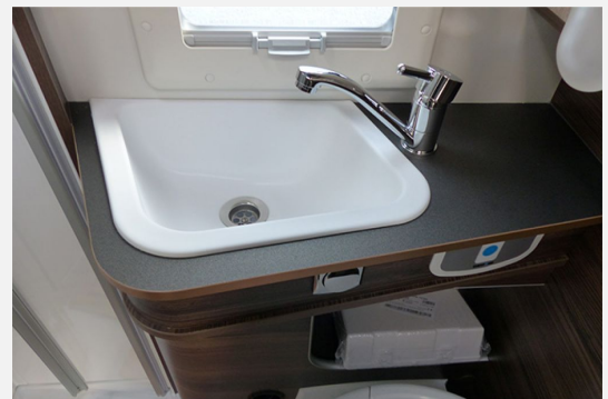
Camper NRW by Hartmann GmbH – Verkauf, Vermietung und Service von Reisemobilen Alfred-Nebel-Str. 7 | 41515 Grevenbroich | Tel.: 021 81 / 65 56-10 00 | anfragen@camper-nrw.de | www.camper-nrw.de