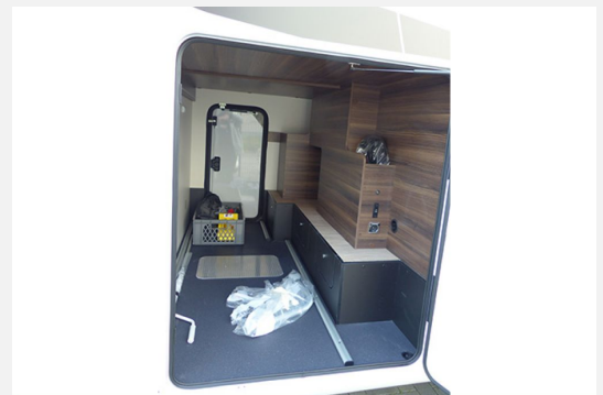
Camper NRW by Hartmann GmbH – Verkauf, Vermietung und Service von Reisemobilen Alfred-Nebel-Str. 7 | 41515 Grevenbroich | Tel.: 021 81 / 65 56-10 00 | anfragen@camper-nrw.de | www.camper-nrw.de CAMPER NRW