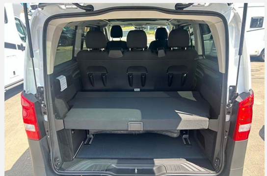
Camper NRW by Hartmann GmbH – Verkauf, Vermietung und Service von Reisemobilen Alfred-Nebel-Str. 7 | 41515 Grevenbroich | Tel.: 021 81 / 65 56-10 00 | anfrage@camper-nrw.de | www.camper-nrw.de CAMPER NRW