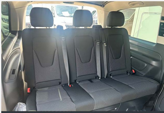
Camper NRW by Hartmann GmbH – Verkauf, Vermietung und Service von Reisemobilen Alfred-Nobel-Str. 7 | 41515 Grevenbroich | Tel.: 021 81 / 65 56-10 00 | anfrage@camper-nrw.de | www.camper-nrw.de