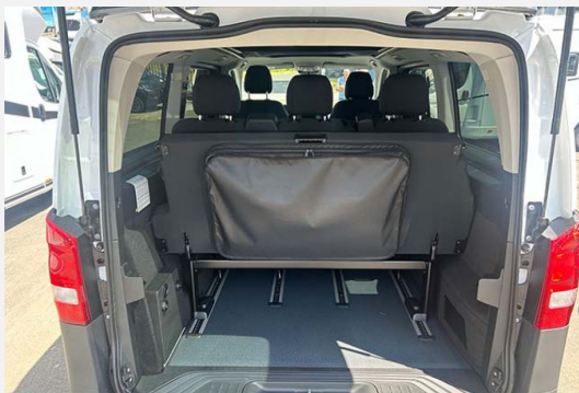
Camper NRW by Hartmann GmbH – Verkauf, Vermietung und Service von Reisemobilen Alfred-Nebel-Str. 7 | 41515 Grevenbroich | Tel.: 021 81 / 65 56-10 00 | anfrage@camper-nrw.de | www.camper-nrw.de CAMPER NRW