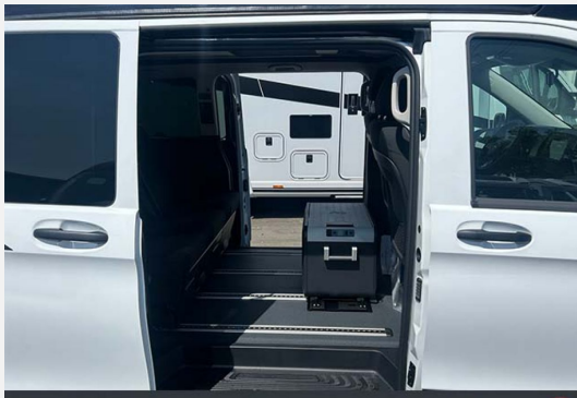
Camper NRW by Hartmann GmbH – Verkauf, Vermietung und Service von Reisemobilen Alfred-Nobel-Str. 7 | 41515 Grevenbroich | Tel.: 021 81 / 65 56-10 00 | anfrage@camper-nrw.de | www.camper-nrw.de